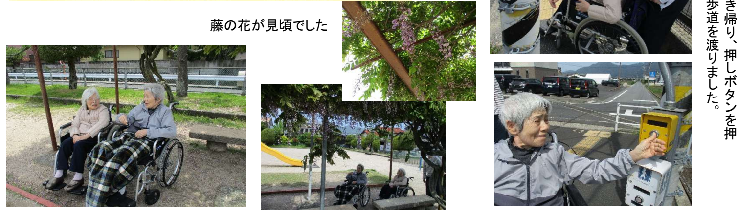
藤の花が見頃でした

小山団地西児童公園に散歩に出掛けました。ハートフルからとても近い距離にある公園ですが、足を運んだのは実に数年ぶり。遊具があり、植栽も綺麗に手入れされていて素敵な公園でした。これからも気軽に出かけたいと思います。