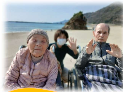
🌸春のドライブ外出🌸