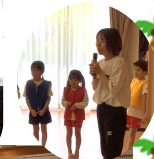
子供たちに皆さん、釘付け。手拍子をしながら見ておられる方もいました。