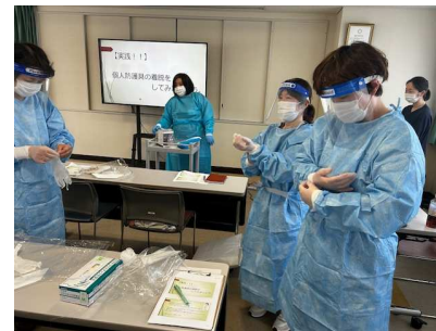
出雲徳洲会病院での研修の様子

新型コロナウイルス感染症が5類感染症となり1年以上経過しました。しかし、高齢者や基礎疾患のある方にとっては重症化のリスクがあり、油断のできない感染症であることには変わりはありません。今年度の介護報酬改定において、感染症に対する事業継続計画の策定や感染症まん延防止のための研修訓練が義務化され、感染者が発生した場合に、協力医療機関と連携し、施設内での対応を適切に行ない、感染拡大を防止することが求められました。そこで、天神では、課長・看護師が代表で出雲徳洲会病院における感染症対応研修を受け、また、出雲徳洲会病院の感染管理認定看護師の方に来設していただき、実地指導をうけました。