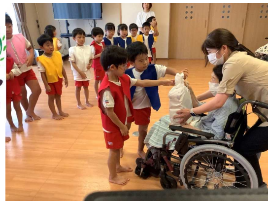
お礼にジュースを渡しました。