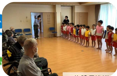
施設長挨拶。 みなさん、行儀いいですね。