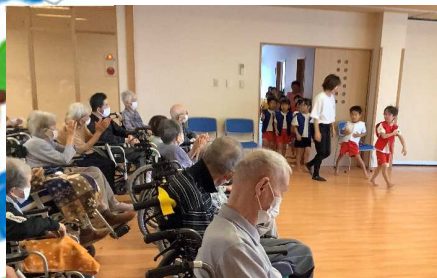
元気いっぱい、登場。 拍手でお出迎えです

コロナ禍で途絶えていた、わたりはし保育園との交流会を、今年度から再開することとしました。当日は暑い中、25名のぞう組の皆様が来所して踊りを披露してくださいました。