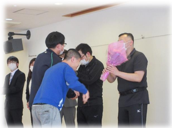
3月29日(金)、離任式が行われました。別れの挨拶とご利用者から花束の贈呈がありました。