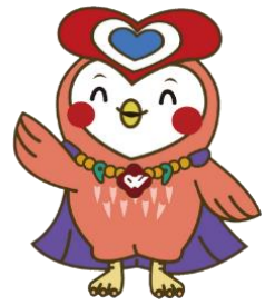
島根県社会福祉事業団 公式マスコットキャラクター フクるん