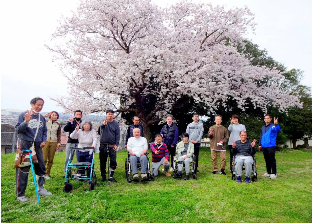
4月のベストショット（敷地内にある桜の前での一枚）

青葉を吹き渡る心地よい風が吹く頃となりましたが、皆様にはご清栄のこととお慶び申し上げます。