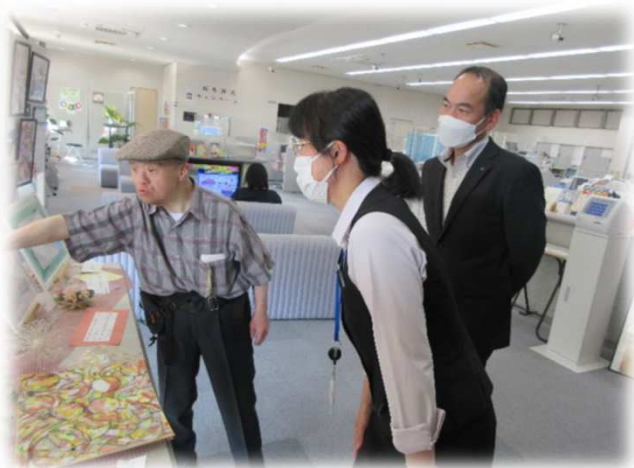
作品の説明を熱心にされていました