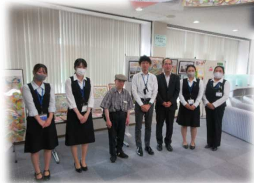
職員の皆さんと集合写真！