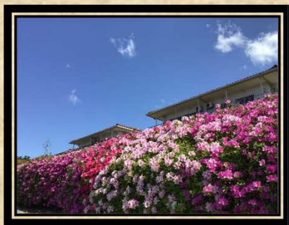
作品名：つつじの園