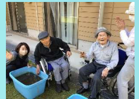
自分の順番が終わられた方は応援部隊に変身！↓