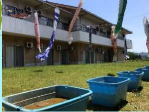
↑五月晴れの5月10日 こいのぼりの泳ぐ中庭は準備万端