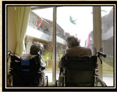
作品名：ある日の風景