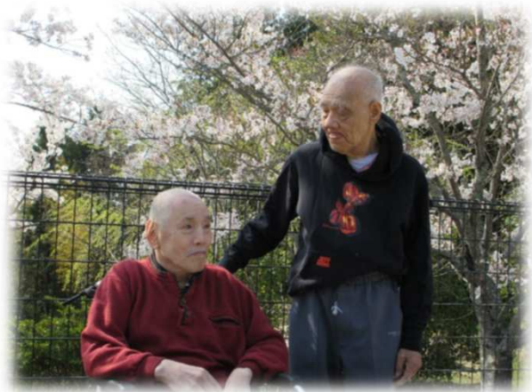
◀▲4月、花見 今年も桜は満開でした。

にやってみて来たスタッフ、新たに採用したスタッフとともに清風園実践理念「意思を尊重し、生活を豊かに、そして、共に成長します」を念頭に置き、チーム清風園でご利用者の支援を行って参ります。さて、コロナ禍においてご利用者の生活は、制限せざるを得ない状況が続いています。島根県は「県内においては、第七波に入ったという前提で対応する必要がある」という認識に至っている。この見解を示しており、まだまだコロナ禍が継続する状況です。このような時だからこそ、スタッフの力量が問われると思います。清風園のスタッフはコロナ禍においても、創意工夫しながら、ご利用者の笑顔を引き出し、ご利用者支援に全力を尽くして参ります。ご家族の皆様、関係者の皆様におかれましては、今後ともご指導、ご鞭撻を賜りますようお願い申し上げます。