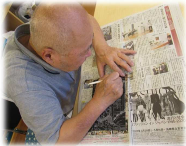
“スクラッチアート”

のぞみグループのご利用者の方々で作成された「アイロンビーズ」と「スクラッチアート」です。 「アイロンビーズ」は同じ形の物でも作成したご利用者様の感性でビーズの色を組み合わせられるので、様々な配色の作品に仕上がっています。 「スクラッチアート」もアイロンビーズと同様に繊細な指先の作業ですが皆さんとても熱心に取り組み、素敵な作品がたくさん出来上がりました。 これらの作品は玄関前の廊下に展示しており、多くの方に鑑賞されること、ご利用者の皆様の大きな喜びとなっています。