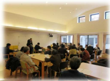
“研修会 「成年後見制度について」”