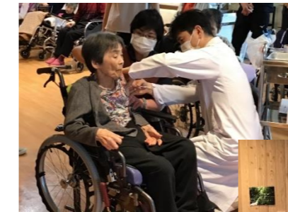
皆さまじっと我慢してくださいました。