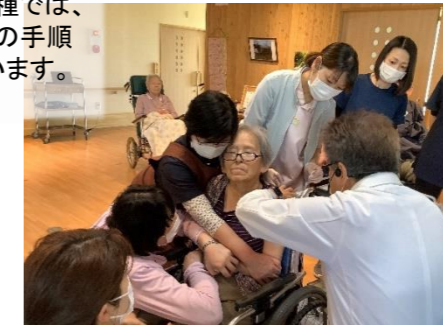
いよいよ接種です！一人目の接種では、職員が実際の手順を見学しています。