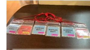
リスクのある方がわかるように、つけていただきました。