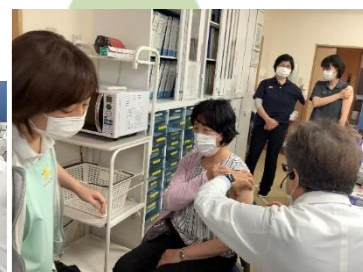
発熱などの副反応がでた方が数名おられました。無事に接種が終了しています。2回目接種後2週間後には抗体ができるそうです。