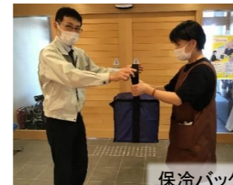
保冷バッグで冷凍状態で配送です。前日までは冷凍庫で保管します。