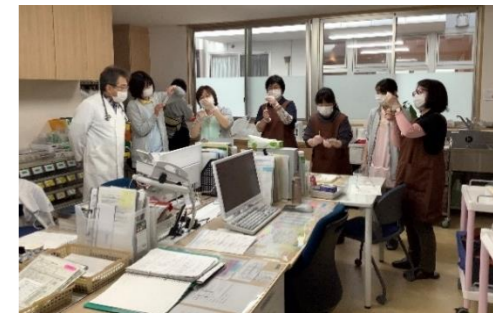
当日に注射器に準備します。常温に戻してからは6時間内に使用しなくてはなりません！