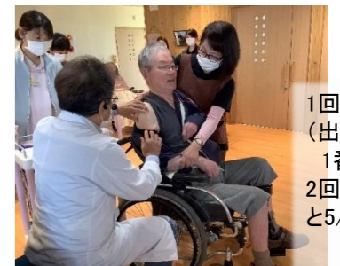
1回目の接種を4/20（出雲市高齢者で1番目）と4/22、2回目の接種を5/11と5/13に行いました。