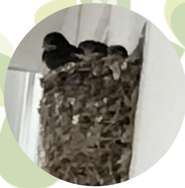
天神 ツバメ 今年も無事に大きくなりました。