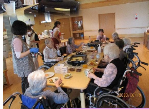
ホットケーキ作り