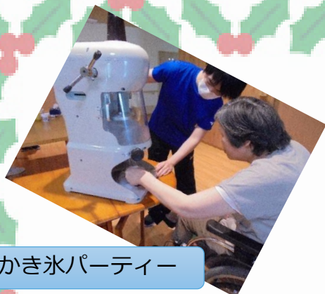
かき氷パーティー

感染予防のために、施設全体での行事や活動は難しいですが、楽しみのある生活が送れるように、それぞれのユニットが工夫して、様々な活動を行っています。