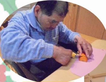
カレーライス作り