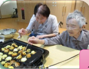
たこ焼き パーティー