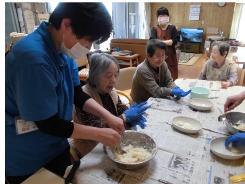
そうめん 団子作り