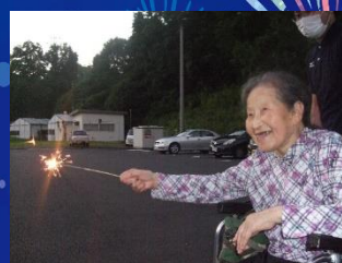
あやめ・つつじユニット 《夕暮れの花火》

出来上がった箱寿司を懐かしんで食べられる方やいつもより沢山食べられる方もおられ皆さんにとって楽しい一時となったようです。