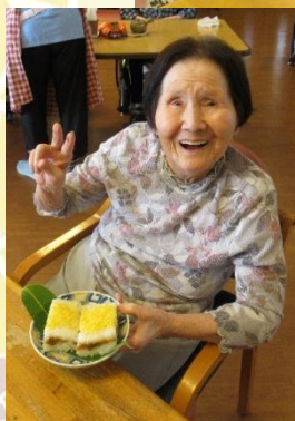
かきつばたユニット 《箱寿司づくり》

献立のちらし寿司の日に合せ、調理員を中心に箱寿司づくりを行いました。入居者の皆さんは、作り方を聞かれたり、味見をされたりと箱寿司づくりの様子を熱心に見学しておられました。