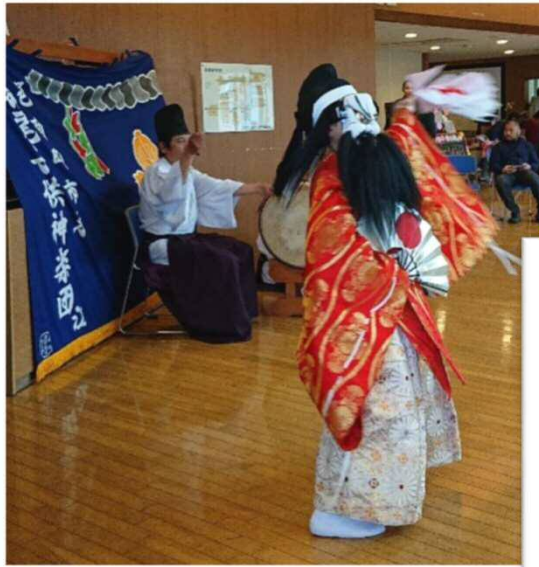
すぎお 梶尾子供神楽団