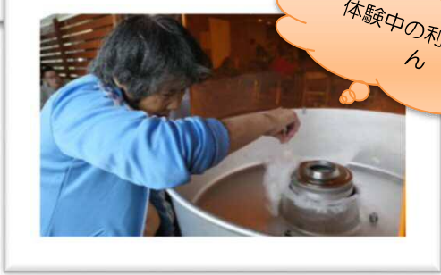
体験中の利用者さん

緑風祭の露店では、みずほ食品さんがドーナツ・ソフトクリーム 緑風園職員は、お好み焼き・わた菓子・フランクフルトを作って販売しました。利用者様、ご家族様にたくさん購入していただき、完売できました。わた菓子は利用者様も楽しんで作られていました。