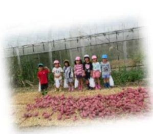
たくさん収穫できました！