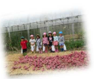
たくさん収穫できました！