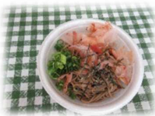
おいしそうなお蕎麦です

初めての試みでしたが、皆さん興味深そうに見学され、完成した蕎麦を嬉しそうに食べておられました。今後も皆で楽しめる行事を企画して、親睦を深めていきたいと思えます。