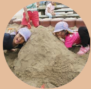
健康で生き生きと遊べる子

たのしく充実した保育所生活を通して、健康で活かに満ちた子どもたちを育てるために、その芽を大切に育み、すくすくと伸びる力を培うことが、私たちしらとり保育所の使命です。