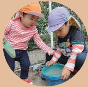
思ったことが言える子