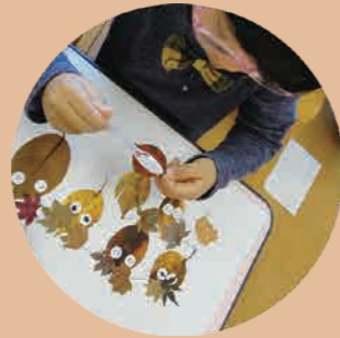
美しいもの、美しいことを求める子