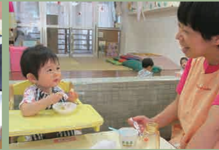
あそび おやつ 食事 午睡