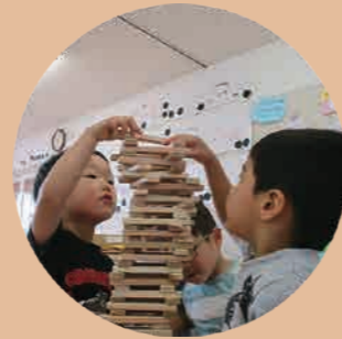
物を大事にし、思いやりのある子