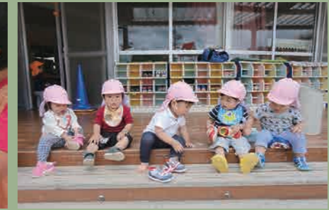
あそび 降所 延長保育